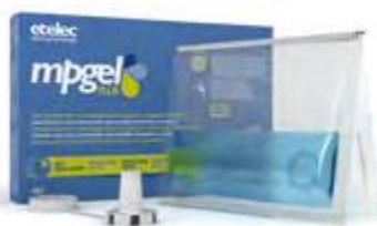
sacchetti in 4 formati