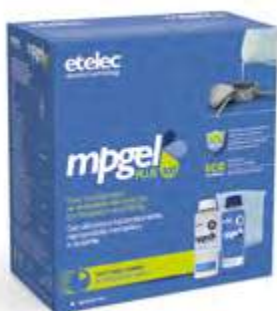
flaconi in 2 formati