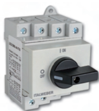
Sezionatore LS 32 LS 32 Switch disconnector