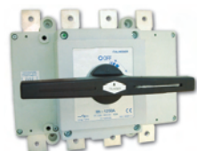
Interruttore sezionatore W1250-3 W1250-3 switch disconnector

The switch disconnectors for direct current (DC) applications are available in several versions. They are suitable for the disconnection of the cables coming from the PV panels are directed towards the inverter in photovoltaic systems. Direct handles or interlocked handles are available, along with all the necessary accessories for protection and management. For optimal use, we recommend to consult the technical tables on page 273. Attention must be paid to the fact that the data in the tables refer to switch disconnectors whose poles have already been bridged, according to the electrical schemes visible on page 274.