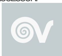
KIT STAFFE THERMOLOGIKA DESIGN Codice 22496