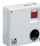
SCRR/M Codice 12965