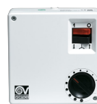
SCRR5 Codice 12963