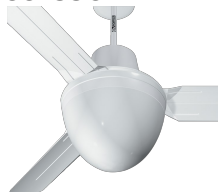
EVOLUTION LIGHT KIT Codice 22413