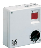
C 1.5 (COMANDO EL. 1.5 A) Codice 12966