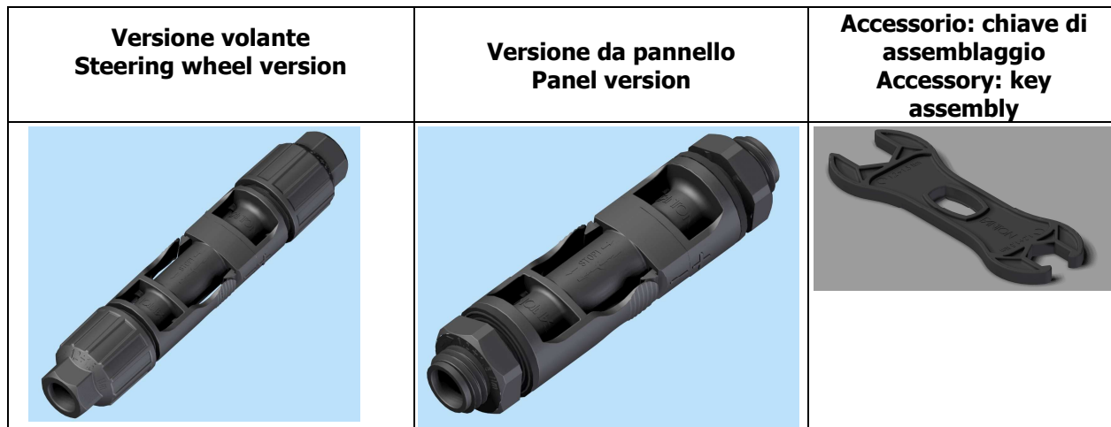
TABLE 1 (codes) / Tabella 1 (codifica)