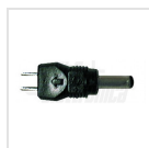
Ø3,5 - 1,35mm