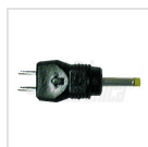
Ø2,35 - 0,75mm