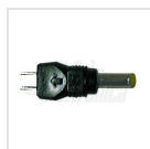
Ø4,0 - 1,70mm